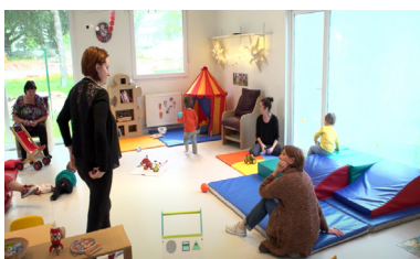
Photo issue de la vidéo de promotion des Laep de Charente Maritime

Des recrutements dans le domaine du soutien à la parentalité dans les P.-O.