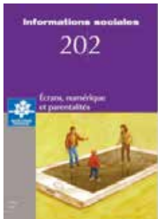
Écrans, numérique et parentalités