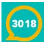
Le nouveau numéro contre les violences numériques du Plan urgence Enfance