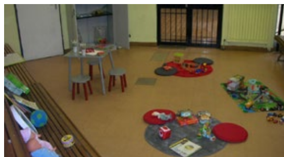
Salle des visites parents-enfants accompagnées par l'association REPPC au Centre pénitentiaire de Perpignan

→ Plus d'informations sur www.mon-enfant.fr , rubrique « Près de chez vous »